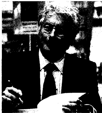
Il romanziere Ken Follett